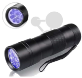
UV-Lampe (langwellig ~ 400nm) Bestellnummer 1245010