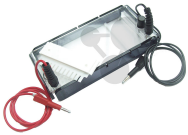
Elektrophorese-Klassenkit Bestellnummer 1103112