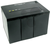
UV-Lampe mit Kammer Bestellnummer 1113139