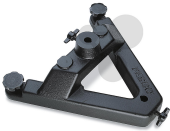
Stativfuß V-Form Bestellnummer 1041513