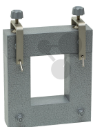
U-Kern mit Joch und Spannvorrichtung Bestellnummer 1040302