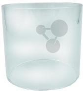
Ersatzrezipient für RayTraX1 Bestellnummer 1009042