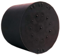
Stopfen Nitrilkautschuk 18/14mm ohne Loch Bestellnummer 1093386