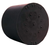
Stopfen Nitrilkautschuk 22/17mm ohne Loch Bestellnummer 1093389