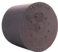
Gummistopfen 22/17mm ohne Loch Bestellnummer 1093373