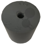
Gummistopfen 32/26mm 1 Loch 6mm Bestellnummer 1093380