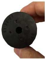
Stopfen Nitrilkautschuk 32/26mm 1 Loch 6mm Bestellnummer 1093396