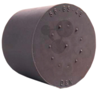
Gummistopfen 32/26mm ohne Loch Bestellnummer 1093379