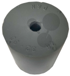
Gummistopfen 32/26mm 1 Loch 6mm Bestellnummer 1093380