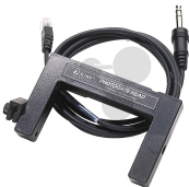
Gabellichtschranke Bestellnummer 1041022