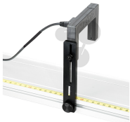
Lichtschrankenhalter 2 Stk. Bestellnummer 1041586