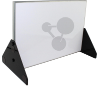
Metalltafel 600 x 400 mm Bestellnummer 1102002