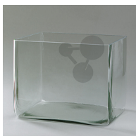
Glaswanne 150 / 100 / 300 mm Bestellnummer 1040630