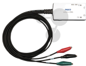
Smart EKG-Sensor Bestellnummer 1214029