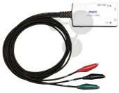
Smart EKG-Sensor Bestellnummer 1214029