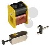
Startvorrichtung elektromagnetisch Bestellnummer 1042276