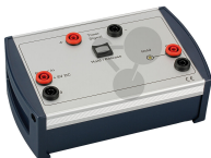
Auslöser für elektromech. Startvorrichtung Bestellnummer 1132021