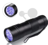
UV-Lampe (langwellig ~ 400nm) Bestellnummer 1245010