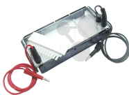
Elektrophorese-Klassenkit Bestellnummer 1103112