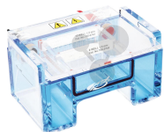
PerfectBlue Gelsystem, Mini Bestellnummer 1215009