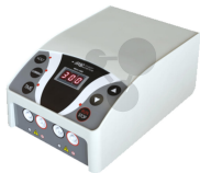
Stabilisiertes Netzgerät für die Gelelektrophorese Bestellnummer 1113220