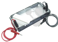
Elektrophorese-Klassenkit Bestellnummer 1103112