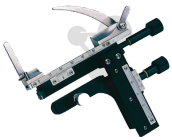
Kreuztisch MSH (X/Y-Tisch) Bestellnummer 1093238