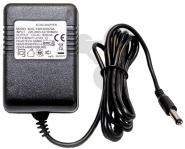
Universal Steckernetzgerät 12 V / 20 W AC Bestellnummer 1192126