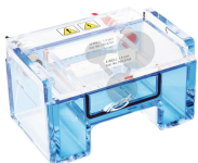
PerfectBlue Gelsystem, Mini Bestellnummer 1215009