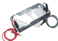
Elektrophorese-Klassenkit Bestellnummer 1103112