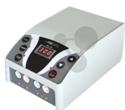
Stabilisiertes Netzgerät für die Gelelektrophorese Bestellnummer 1113220