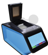
PCR-Cycler 2 Bestellnummer 1193079