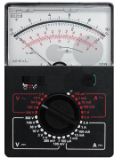
Analog-Vielfachmessgerät Nullpunkt Links / Mitte Bestellnummer 1040142