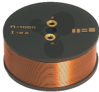
Demonstrations-Zusatzspule Bestellnummer 1095004