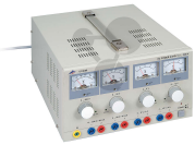
Netzgerät 0 - 500 V für Elektronenröhren Bestellnummer 1222134