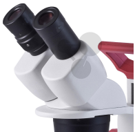
Okular WF 10x/20mm Bestellnummer 1113064