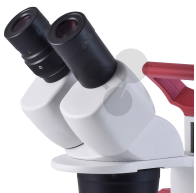
Okular WF 15x/13mm Bestellnummer 1113065