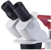
Okular 30x/8mm Bestellnummer 1113067