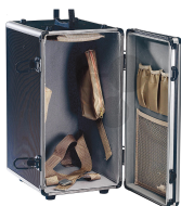
Mikroskopschrank Bestellnummer 1040121