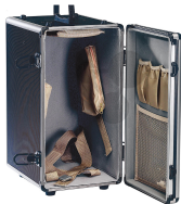
Mikroskopschrank Bestellnummer 1040121