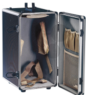
Mikroskopschrank Bestellnummer 1040121