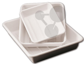
Färbewanne säurefest 20 cm Bestellnummer 1113146