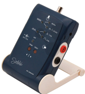
40 kHz Ultraschallgenerator Bestellnummer 1212072