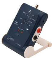
40 kHz Ultraschallgenerator Bestellnummer 1212072