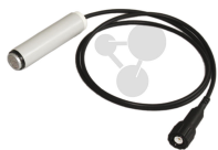
Ultraschallempfänger (40 kHz) Bestellnummer 1132047