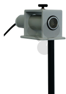
Halter für Ultraschallsender und -empfänger Bestellnummer 1132050