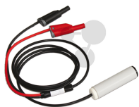
Ultraschallsender (40 kHz) Bestellnummer 1132046