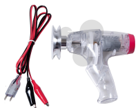
Handgenerator mit Schnurrolle Bestellnummer 1132036