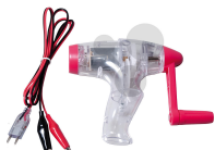
Handgenerator 12 V Bestellnummer 1132035