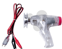
Handgenerator mit Schnurrolle Bestellnummer 1132036