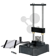
Gerät zur Messung der Zugfestigkeit von Materialproben Bestellnummer 1142062