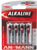
Batterie Mignon 1,5V AA-R6 Bestellnummer 2004714