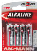
Batterie Mignon 1,5V AA-R6 Bestellnummer 2004714