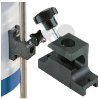
Stativklemme für Gehäuseheizhauben KM