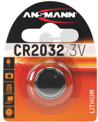
Lithium Knopfzelle 3V CR2032 Bestellnummer 2012803