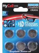
Lithium Knopfzelle 3V CR2032 6 Stk. Bestellnummer 1192043