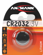
Lithium Knopfzelle 3V CR2032 Bestellnummer 2012803