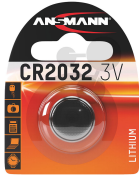
Lithium Knopfzelle 3V CR2032 Bestellnummer 2012803