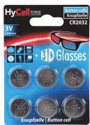
Lithium Knopfzelle 3V CR2032 6 Stk. Bestellnummer 1192043