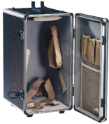
Mikroskopschrank groß Bestellnummer 1040122