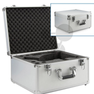
Transportkoffer Aluminium Bestellnummer 1167717