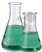
Erlenmeyerkolben 100 ml Enghals Borosilikatglas DURAN® Bestellnummer 1113017