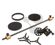
Rotationszubehör Bestellnummer 1194008