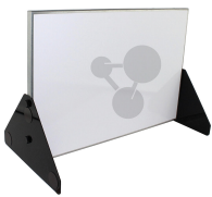
Metalltafel 600 x 400 mm Bestellnummer 1102002