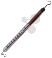
Federkraftmesser 5 N / 0,1 N Bestellnummer 1122046