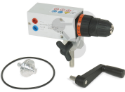
Experimentiermotor mit Getriebe Bestellnummer 1192065