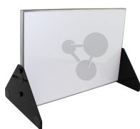
Metalltafel 600 x 400 mm Bestellnummer 1102002