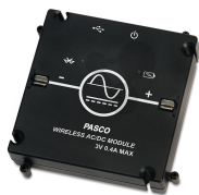
Smart Funktionsgenerator Baustein Bestellnummer 1192181