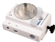
Smart Drehbewegungssensor Bestellnummer 1184030