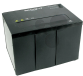
UV-Lampe mit Kammer Bestellnummer 1113139