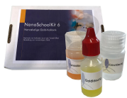
Experimentierkoffer "Neue Materialien" Nachfüllpack 6 Bestellnummer 1103122