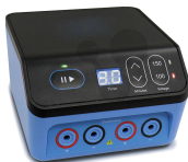
Stabilisiertes Netzgerät für die Gelelektrophorese Duo Bestellnummer 1233013