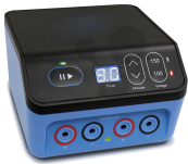
Stabilisiertes Netzgerät für die Gelelektrophorese Duo Bestellnummer 1233013