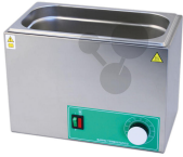
Wasserbad analog 6 Liter Bestellnummer 1163007