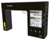
Speedgate Bestellnummer 1172008