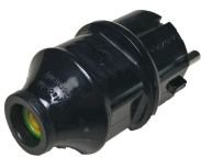
Erdungsstecker Bestellnummer 1192109