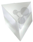
Prisma Flintglas 40x40x40 mm Bestellnummer 1152044