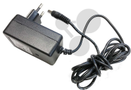
Netzteil für Mikroskop 4,5 V Bestellnummer 1193044