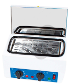
Sterilisator Bestellnummer 1235020